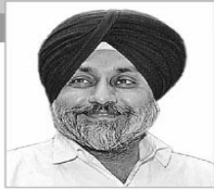
ਸ੍ਰ: ਸੁਖਬੀਰ ਸਿੰਘ ਬਾਦਲ ਉੱਪ ਮੁੱਖ ਮੰਤਰੀ, ਪੰਜਾਬ